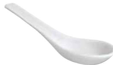
◇ 67303M07 Chinese spoon Cucchiaio cinese Porzellanlöffel

M05 11 x 8 cm - 4 3 / 8 x 3 1 / 8 in. M06 16 x 11 cm - 6 1 / 4 x 4 3 / 8 in.