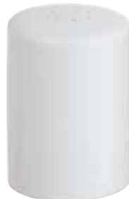
◇ 67303-96 Salt shaker Spargisale Salzstreuer