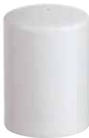
◇ 67303-97 Pepper shaker Spargipepe Pfefferstreuer

h 10 cm - Ø 6,3 cm h 4 in. - Ø 2 1 / 2 in.