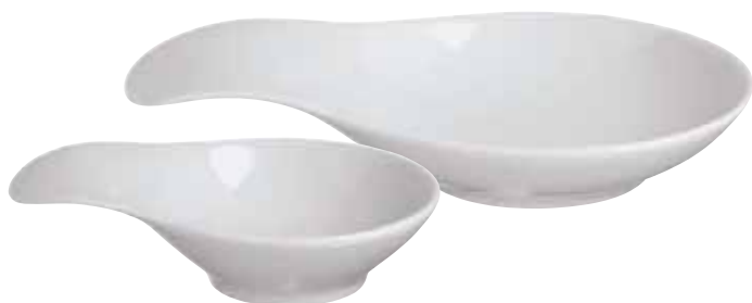
◇ 67303 Finger food "Coppetta" Piattino "Coppetta" Fingerfood Schalen "Coppetta"

M05 11 x 8 cm - 4 3 / 8 x 3 1 / 8 in. M06 16 x 11 cm - 6 1 / 4 x 4 3 / 8 in.