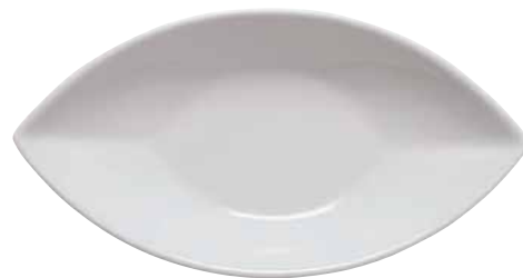
◇ 67303M02 Finger food "Gondola" Piattino "Gondola" Fingerfood Schale "Gondola"

9,5 x 6,5 cm h 3 cm 3 3 / 4 x 2 1 / 2 in. h 1 1 / 8 oz.