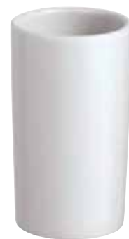
◇ 67303-98 Toothpick holder Portastecchi Zahnstocher-Halter