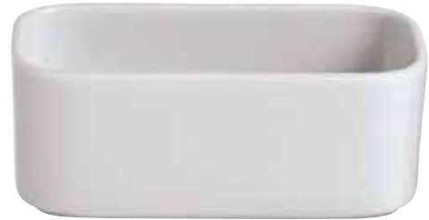
◇ 67303-64 Sugar bags holder Porta bustine Zuckerpäckchen-Halter