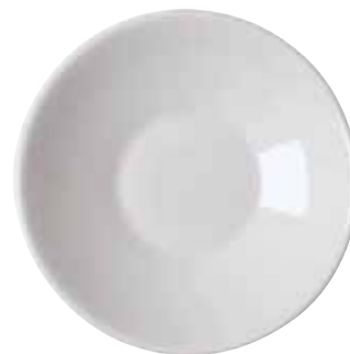
◇ 67303M04 Finger food "Rondel" Piattino "Rondel" Fingerfood Schale "Rondel"