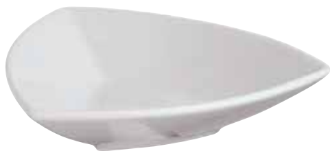
◇ 67303M03 Finger food "Trident" Piattino "Trident" Fingerfood Schale "Trident"