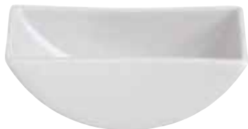
◇ 67303M01 Finger food "Seesaw" Ciotolina "Seesaw" Fingerfood Schale "Seesaw"

9,5 x 6,5 cm h 3 cm 3 3 / 4 x 2 1 / 2 in. h 1 1 / 8 oz.