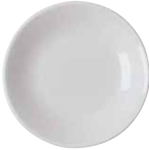
◇ 67303-20 Sauce plate Piattino salsa Dipschale