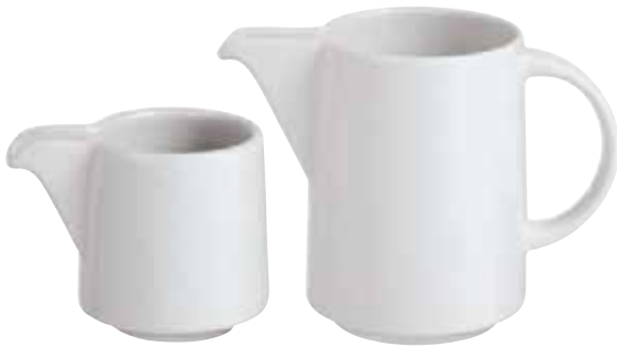
◇ 67303 Sauciere Salsiera Sauciere

-79 0,20 lt. - 7 oz. -78 0,30 lt. - 10 1 / 2 oz.