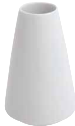
◇ 67303-86 Flower vase Vasetto fiori Blumenvase

-79 0,20 lt. - 7 oz. -78 0,30 lt. - 10 1 / 2 oz.